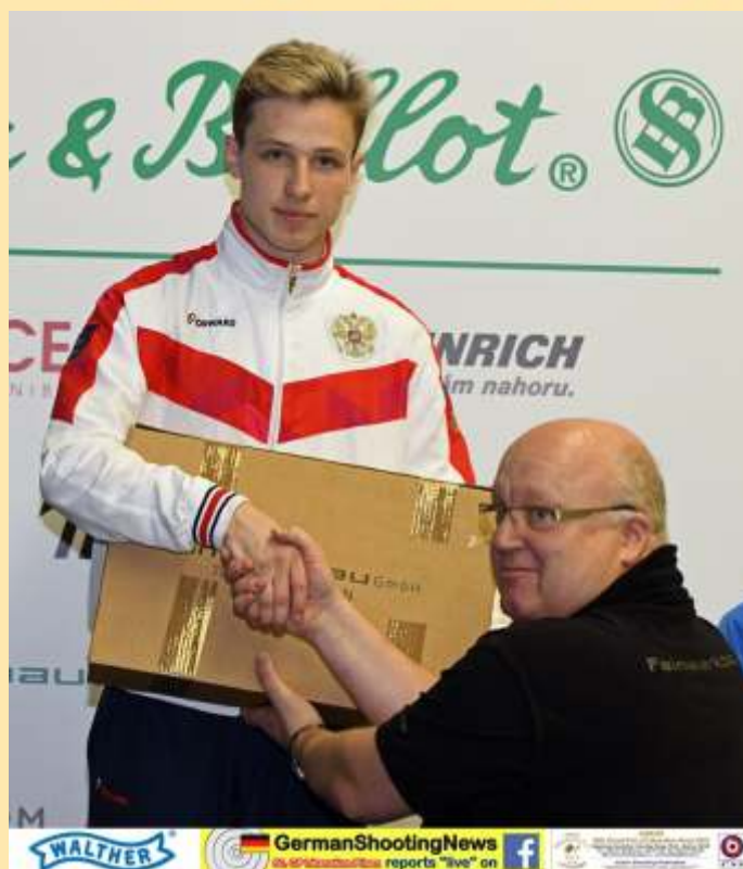
GermanShootingNews reports "live" on